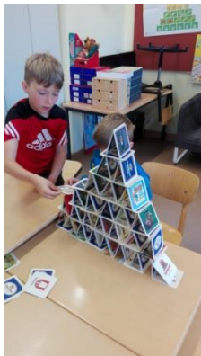
Wer baut den höchsten Turm?