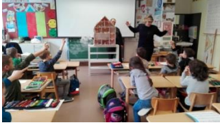
Hilfe, es brennt!