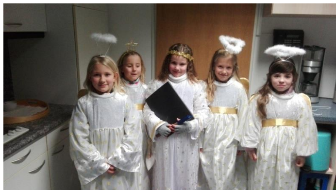
Fünf Engel auf Erden